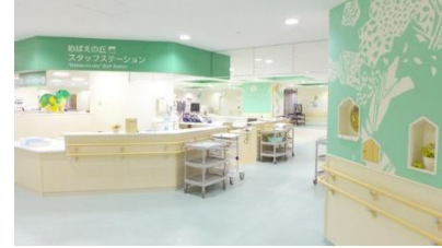
(独)四国こどもとおとなの医療センター内