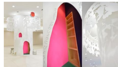
(独)四国こどもとおとなの医療センター内