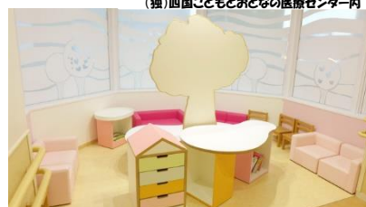
(独)四国こどもとおとなの医療センター内