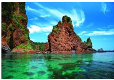
ハルヤ海岸(海士町)