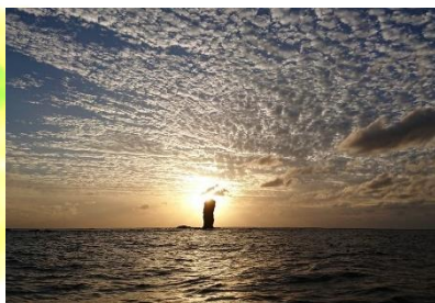
ローソク島(隠岐の島町)